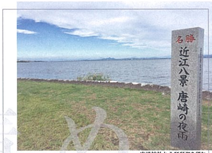
唐崎神社から琵琶湖を望む