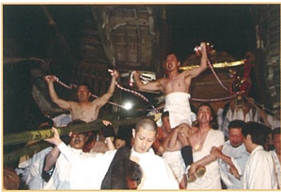
午の神事 12日 二基の神輿が八王子山を出発 ふもとの東本宮へ鎮まる。