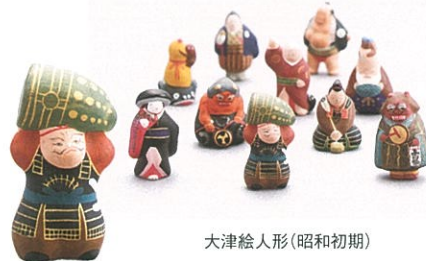
大津絵人形(昭和初期)