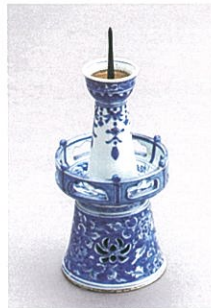
三井御浜焼 燭台 永楽保全作