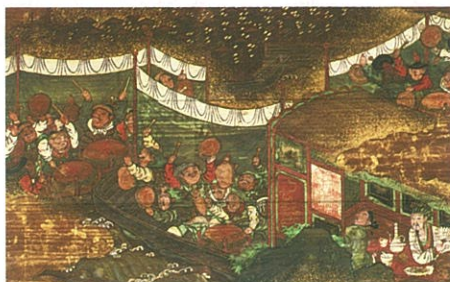
諸葛孔明奇策図絵馬(部分)(江戸時代 1791年)

嘉永4年(1851)に大津に移り住んだ永楽保全(1795~1854年)は三井寺のふもとに窯を開き「三井御浜焼」、「湖南焼」と称する作品を残している。晩年の作風を伝える優品が多く、伝来品も少ないことから高く評価されている。