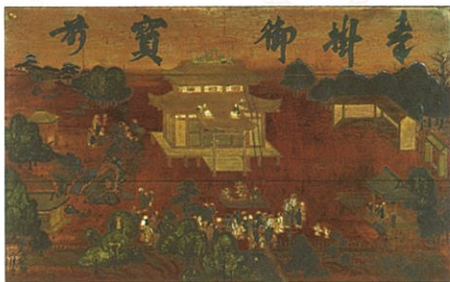
観音堂落慶図絵馬(江戸時代 1690年)