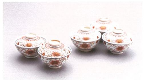
三井御浜焼 南京赤絵蓋茶碗 永楽保全作(1854年)