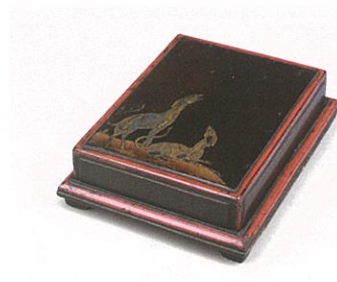
洋犬時絵硯箱(桃山時代)