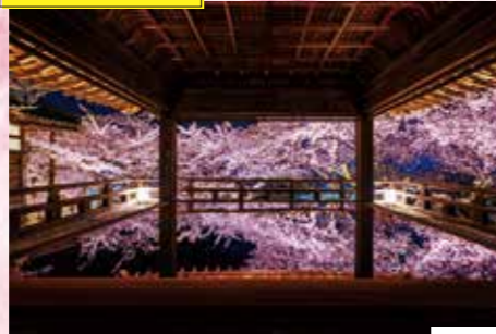
三井寺 春のライトアップ 場所 三井寺