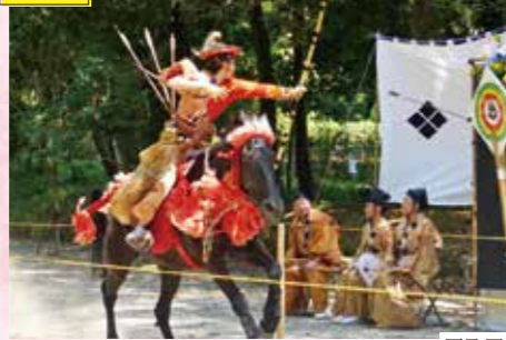
近江神宮 流鏝馬 場所 近江神宮