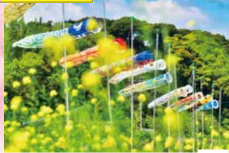
ふれあい鯉のぼり祭り「真野」 場所 真野川堤防