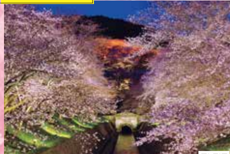
びわ湖大津春のライトアップ～桜の琵琶湖疏水～ 場所 琵琶湖疏水