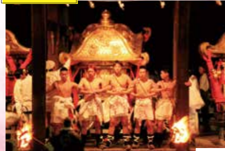
日吉大社 山王祭 場所 日吉大社