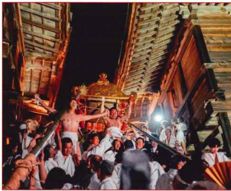
二基の神輿が八王子山を出発 ふもとの東本宮へ鎮まる。