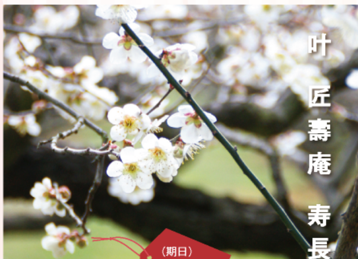
叶匠壽庵 寿長生の郷梅まつり