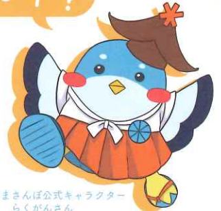
堅田*はまさんぽ公式キャラクター らくがんさん