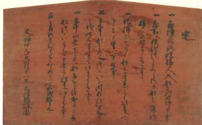
重要文化財 京極高次高札 (文禄4年(1595)9月11日 本館藏) 大津城主となった直後の高次が出した貴重な高札

近江の名門武家である京極氏出身の京極高次。豊臣家と徳川家双方と縁戚関係にあり、文禄4年(1595)9月に大津城主となりました。その後、慶長5年(1600)9月に起こった関ヶ原の戦いの一環である大津城の戦いで東軍方として活躍しました。本展では、大津にもゆかりの深い京極高次の数奇な人生を、当時の史料をもとにたどり、高次の実像に迫るとともに、彼を取り巻く一族についても紹介します。