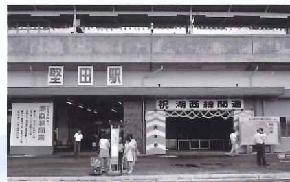
湖西線開通当日の堅田駅 昭和49年