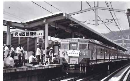
湖西線開通当日の西大津(大津京)駅の様子 昭和49年

昭和49年(1974)7月20日に開業した国鉄(現JR)湖西線は、今年で50周年を迎えます。本展は、江若鉄道から湖西線へのバトンタッチや湖西線開業当時の様子など、湖西線の歴史や特徴を紹介するとともに、沿線の人々や鉄道ファンが記録・保存した品々とそれぞれの記憶から、湖西線50年のあゆみを振り返ります。