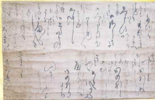
長浜市指定文化財 淀殿消息 (江戸時代初期 知善院藏) 淀殿から義弟である高次に出された、心温まる手紙