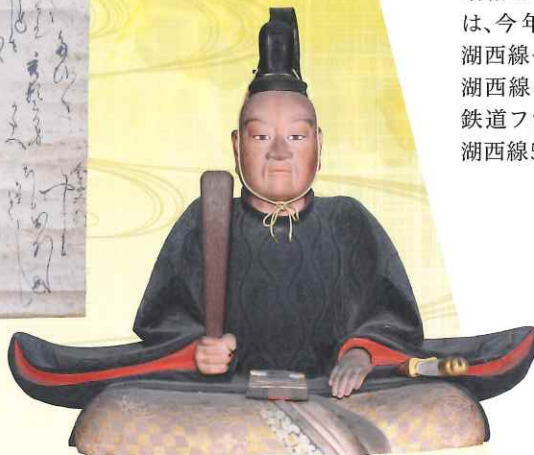
京極高次像 (江戸時代 清瀧寺徳源院藏) 京極家菩提寺徳源院に鎮座する京極家中興の祖高次の木像