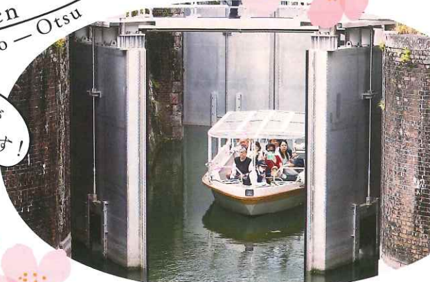
▲大津閘門からびわ湖へ運航するびわ湖疏水船