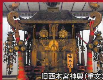
旧西本宮神輿(重文)