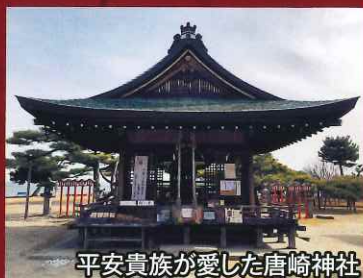
平安貴族が愛した唐崎神社

お祓いの聖地とされ、平安貴族が 愛した名勝地・唐崎神社と、東照大 権現(徳川家康公)を祀り日光東照宮 のひな型となった日吉東照宮にも 足を延ばして是非お参りください。