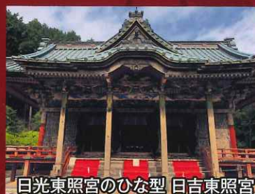
日光東照宮のひな型 日吉東照宮

日吉大社から 車で10分 (JR唐崎駅より 徒歩15分)、 祈祷・授与品は 日祝の 10:00~16:00 (参拝は年中可)