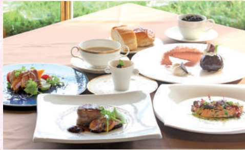
クリスマス特別ディナー(イメージ)