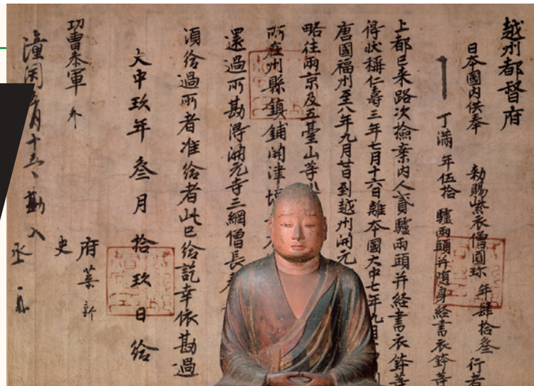
国宝「越州都督府過所」