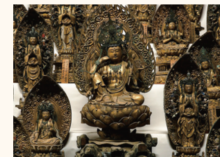
三井寺百体観音像