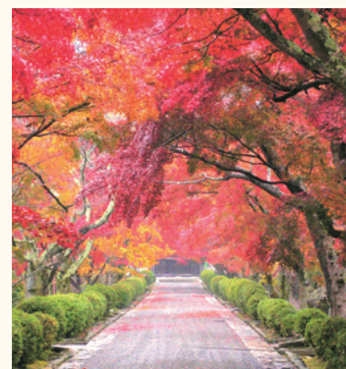
滋賀県知事登録旅行業第2-243号 (公社)びわ湖大津観光協会 TEL：077-528-2772