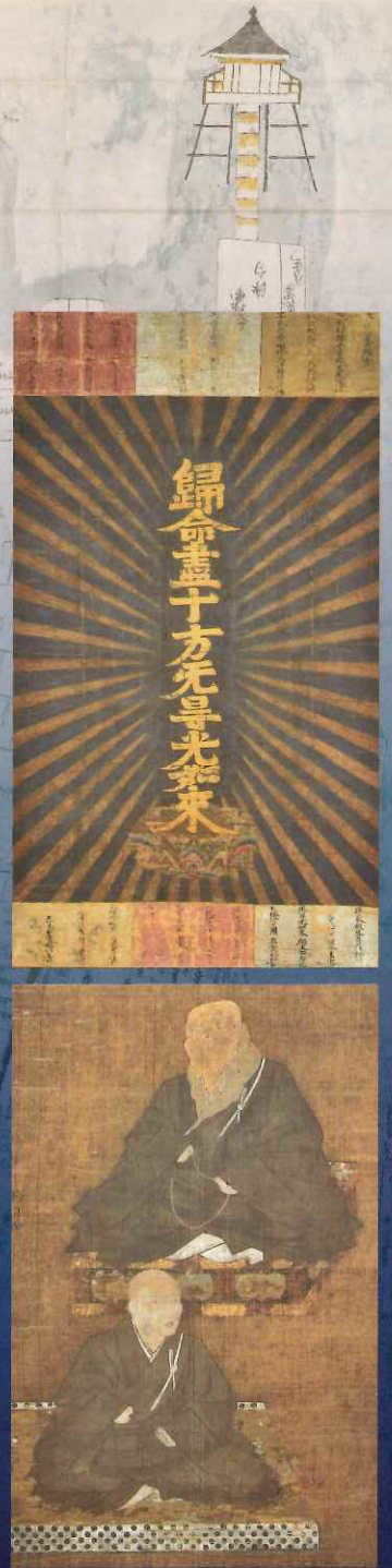
右上:十字名号(登山名号) 室町時代 本福寺蔵 右下:親鸞・蓮如連坐像 室町時代 本福寺蔵 左:大津市指定文化財 本福寺旧記(中世記録) 室町時代 本福寺蔵 背景:本堅田村延宝検地図 江戸時代 伊豆神社蔵