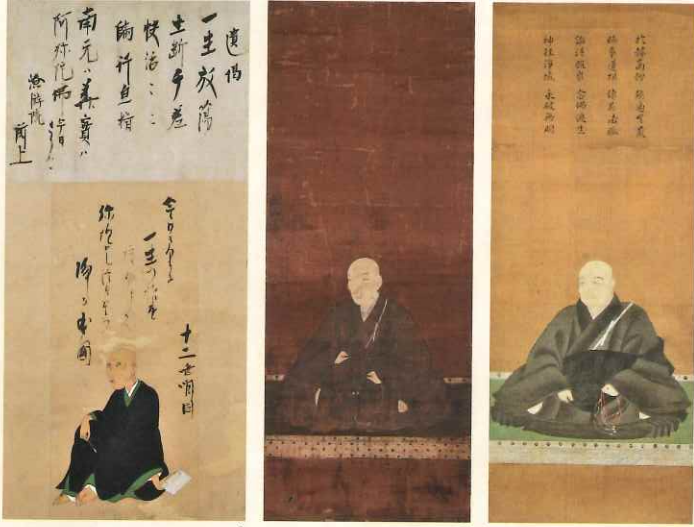
1 2 3