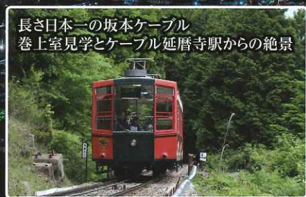
長さ日本一の坂本ケーブル 巻上室見学とケーブル延暦寺駅からの絶景