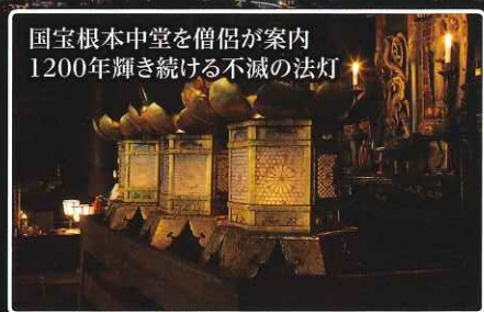
国宝根本中堂を僧侶が案内 1200年輝き続ける不滅の法灯