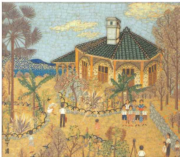
《グラバー邸》貼絵 1956(昭和31)年 個人蔵

“放浪の天才画家”と言われた山下清(1922~71)。18歳で放浪の旅を始め、創作を続けるなか、31歳の時、アメリカのグラフィ誌がその画才に注目し、脚光を浴びるようになりました。その後、「今年の花火見物はどこに行こうかな」の言葉を最後に49歳で生涯を閉じるまで、「日本の原風景」として人々に愛され続けてきた貼絵など多岐にわたる作品を手掛けてきました。本展では、貼絵や油彩、水彩画、ペン画、陶磁器など1961年のヨーロッパ旅行に持参したスケッチブックのうち初公開の習作を含め、約190点を展観。山下芸術の新たな側面を発見するとともに、生誕百年を迎えた「百年目の大回想」という名にふさわしく、その生涯にわたる創作活動を振り返ります。