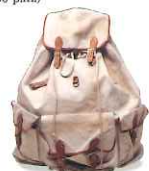
《山下清が放浪時代に使用したリュック》