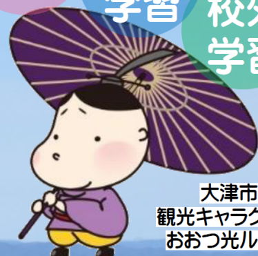
大津市 観光キャラクター おおつ光ルくん