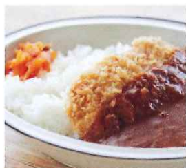
夢見が丘 (比叡山ドライブウェイ沿線)

カフェテラスyumemi ＜主なメニュー＞ ● カツカレー ● ホットサンド ● ソフトクリーム