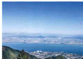
比叡山峰道レストラン&展望台

＜主なメニュー＞ ● 平和丼(ごま豆腐・湯葉・生麩のあんかけ丼) ● 淡海地錦の親子丼 ● (比叡山麓で育った地産と地産卵を使用) ● 峰道特産御膳(近江牛すき焼きがついた贅沢な御膳) ● お山の満月パフェ(お山の満月をイメージした贅沢パフェ) ● ごま豆腐ぜんざい(比叡山名物のごま豆腐を使用)