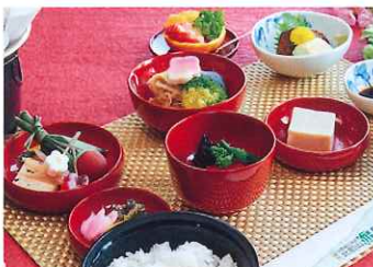
国際観光旅館 延暦寺会館 (延暦寺東塔地域)

＜主なメニュー＞ ● 精進料理 もともとは仏教の修行僧が食していたもので、素材を無駄なく調理することにより生命の尊さを感じる料理です。