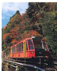
坂本ケーブル (大津市坂本)

坂本と比叡山延暦寺を11分で結ぶ、長さ2,025mと日本一の長さを誇るケーブル。雄大なびわ湖の絶景が望めます。