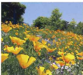
ガーデンミュージアム比叡 (比叡山山頂)

カフェ・ド・パリ ＜主なメニュー＞ ● ピーフシチュー ● ハンバーグ ● カレー ● ケーキセット ● オリジナルハーブティー