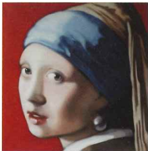
ANDREA RAVO MATTONI 《Echo of Vermeer》2021 ©Artruss - Courtesy of the artist