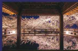
※観月舞台は予約が必要

[お問い合わせ] TEL:077-522-2238 (三井寺 春のライトアップ2022 事務局) 主催:総本山三井寺(園城寺)