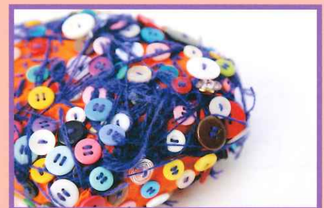
井村ももか《赤い玉》2013年、やまなみ工房