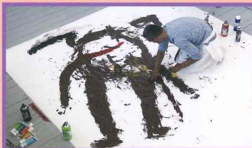
アルトゥール・ジミエフスキ《Blindly》2010年