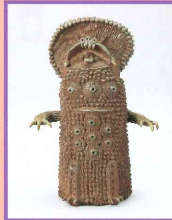
澤田真一《無題》2009年、滋賀県立美術館