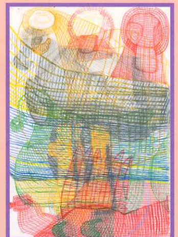
富山健二《無題》制作年不詳、作家蔵