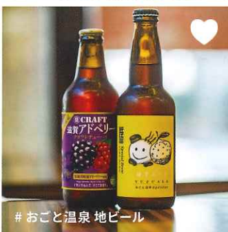
#おごと温泉 地ビール