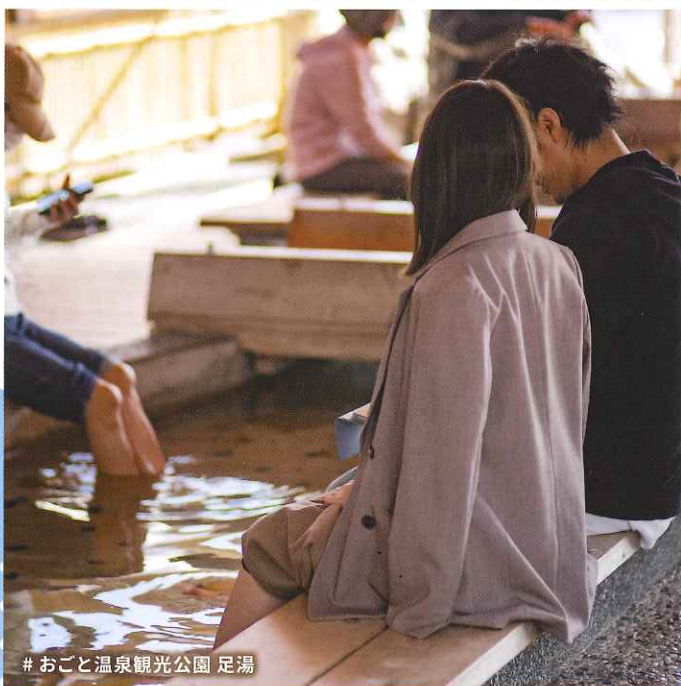
#おごと温泉観光公園 足湯