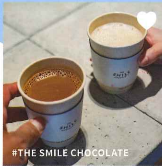
#THE SMILE CHOCOLATE