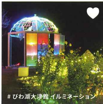
#びわ湖大津館 イルミネーション