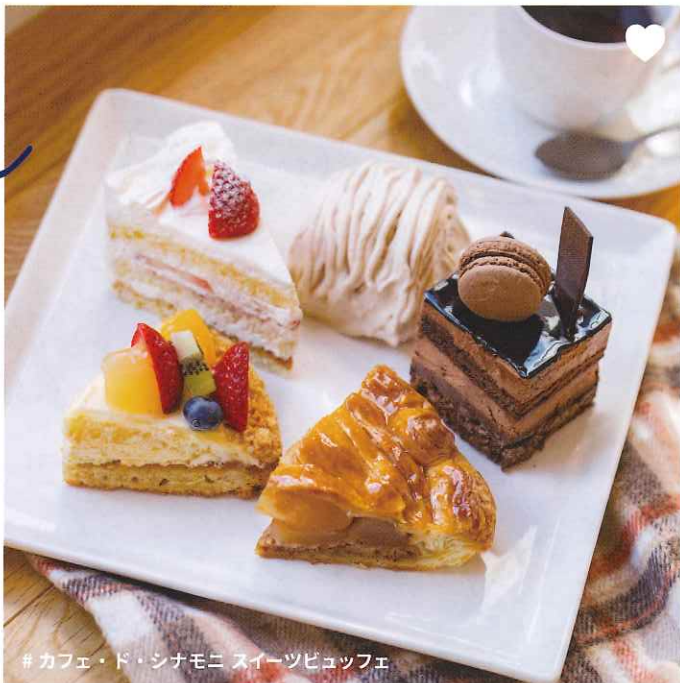
#カフェ・ド・シナモン スイーツビュッフェ