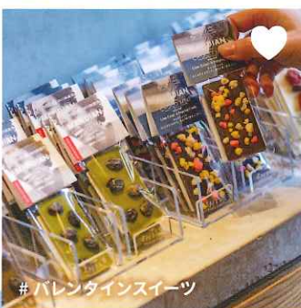
#バレンタインスイーツ