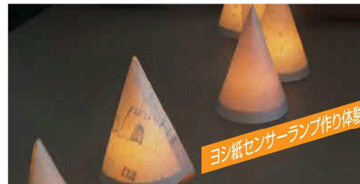
ヨシ紙センサーランプ作り体験