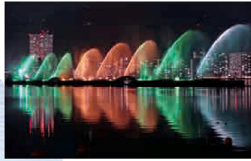
びわ湖花噴水ライトアップ