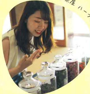
十野/月子茶屋 ハーブ体験