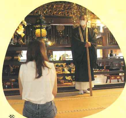
坂本/西教寺 座禅体験