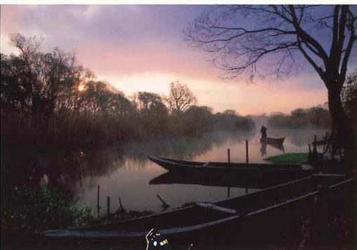
《朝焼けの船着き場》