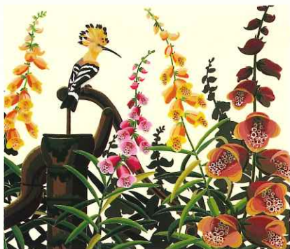
《ヤツガシラとジギタリス》