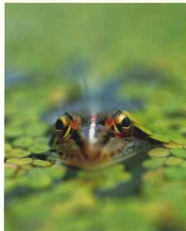
《田んぼから顔を出したノサマガエル》