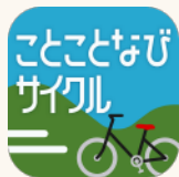
ことことなびサイクル

シェアサイクルサービス「kotobike」がお得に使えるアプリ「ことことなびサイクル」が登場！！