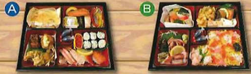
北海道 味わい寿司弁当 北海道 彩りちらし弁当

※仕入れの都合により、写真と一部内容が異なる場合がございますので予めご了承ください。