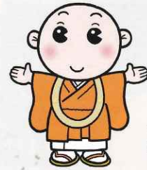
一隅を照らす 運動キャラクター しょうぐうさん

新型コロナウイルス感染症拡大予防対策として今年の特別祈禱は一般席にも定員を設けて予約制とし、内陣特別席は各日10名様限定とさせていただきます。また全席指定とし、堂内に座席を設けさせていただきます。堂内で行われます法要のため、各自マスクをご着用の上お越しください。換気には配慮しておりますが、館内設置の消毒用アルコール液の利用のご協力をお願いいたします。発熱等の症状がある場合はご来山をご遠慮ください。