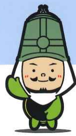
三井寺キャラクター ベンベン

後援/関東大道芸研究会・滋賀県パルーンアート協会・滋賀県江州音頭保存会・ 滋賀県南京玉すだれ保存会・ちんどん屋こうあん一座・さざなみ太鼓 ていだkankan・ききょうちゃん一座・伊吹山ガマの油口上保存会・ 待(まつ)コミュニケーション・紙芝居夢屋商店・よさこい元気隊・ 夢華会・花架祭・ふじの木茶屋