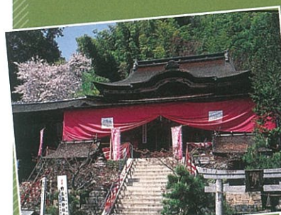
都久夫須麻神社 本殿(国宝)

湖岸から約6kmの沖合にあり、花崗岩からなる周囲約2kmの島。 琵琶湖八景「竹生島の沈影」でも知られています。 国宝や重要文化財に指定されている建物など見どころも多く、 参拝者のほか観光客も多く訪れる人気観光地です。