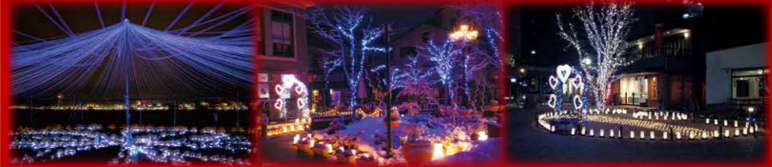
※写真は昨年の様子です