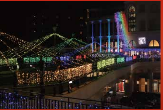
お問い合わせ 長浜会場 (公社)長浜観光協会 ☎0749-65-6521