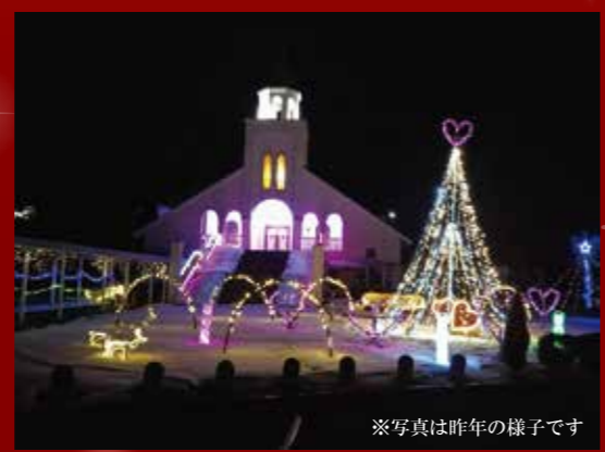
※写真は昨年の様子です