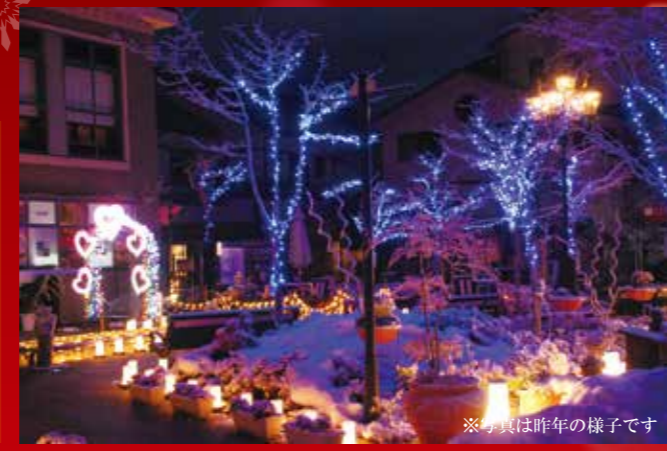
※写真は昨年の様子です お問い合わせ 彦根会場 (公社)彦根観光協会 ☎0749-23-0001

四番町スクエア一帯の街路樹や道路などをLEDでライトアップします。四番町スクエアにはハート型の大きな電飾モニュメントも登場予定です。12月8日(土)には、「彦根灯花会クリスマスバル」も開催。バル当日は、18時頃から四番町スクエアにひこにゃんも登場する予定です。夢京橋キャッスルロード・四番町スクエア周辺の参加店舗にてバルスタイルのワンドリンク&ワンピンチョスを提供。イルミネーションを楽しみながら彦根の食もお楽しみいただけます。