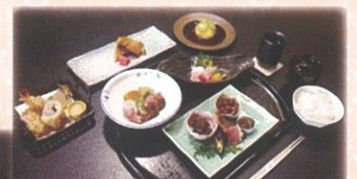
会席料理などへの クレードアップもできます