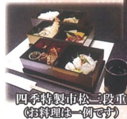
四季特製市松三段重 (お料理は一例です)