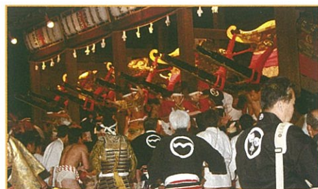
宵宮落し神事 13日 四基の神輿を激しく揺すり、西本宮へと担ぐ。