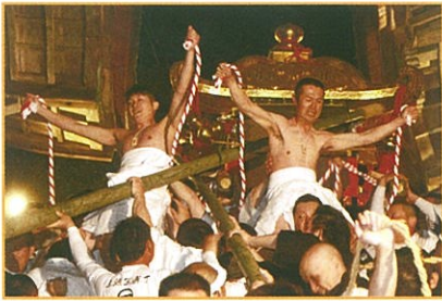
二基の神輿が八王子山を出発 ふもとの東本宮へ鎮まる。