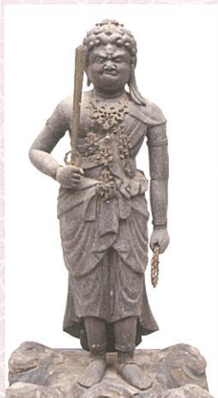
木造不動明王立像 平安時代(12世紀) 園城寺(法明院)蔵