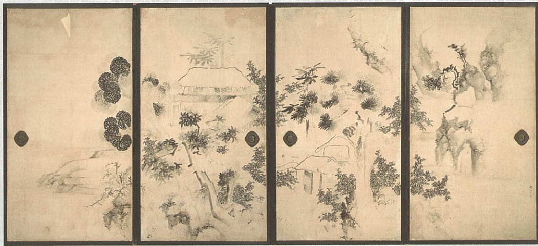
大津市指定文化財 紙本墨画幽居図 池大雅筆 江戸時代(18世紀) 園城寺(法明院)蔵

※出陳品の一部は会期中に展示替えを行いますので、詳細は当館ホームページでご確認ください。 表面使用写真 左上：フェノロサ肖像写真 園城寺(法明院)蔵、左下：大津市指定文化財 紙本墨画山水図 円山応挙筆 江戸時代(18世紀) 園城寺(法明院)蔵 右：絹本着色群鶴図 鶴沢探索筆 江戸時代(18世紀) 園城寺(法明院)蔵、題字：滋野敬淳