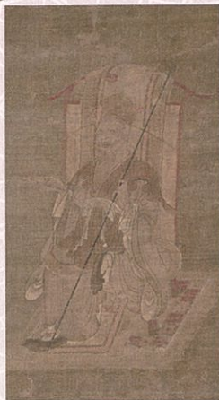
絹本着色新羅明神像 室町時代(15世紀) 園城寺(法明院)蔵